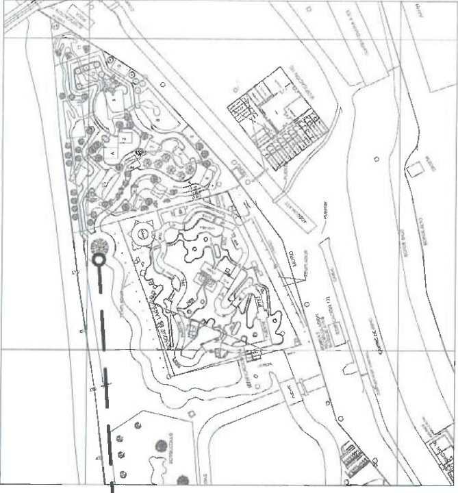
PLANO DE LOCALIZACION ESCALA: S/E