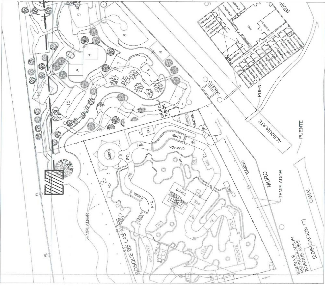
PLANO DE UBICACION ESCALA: S/E